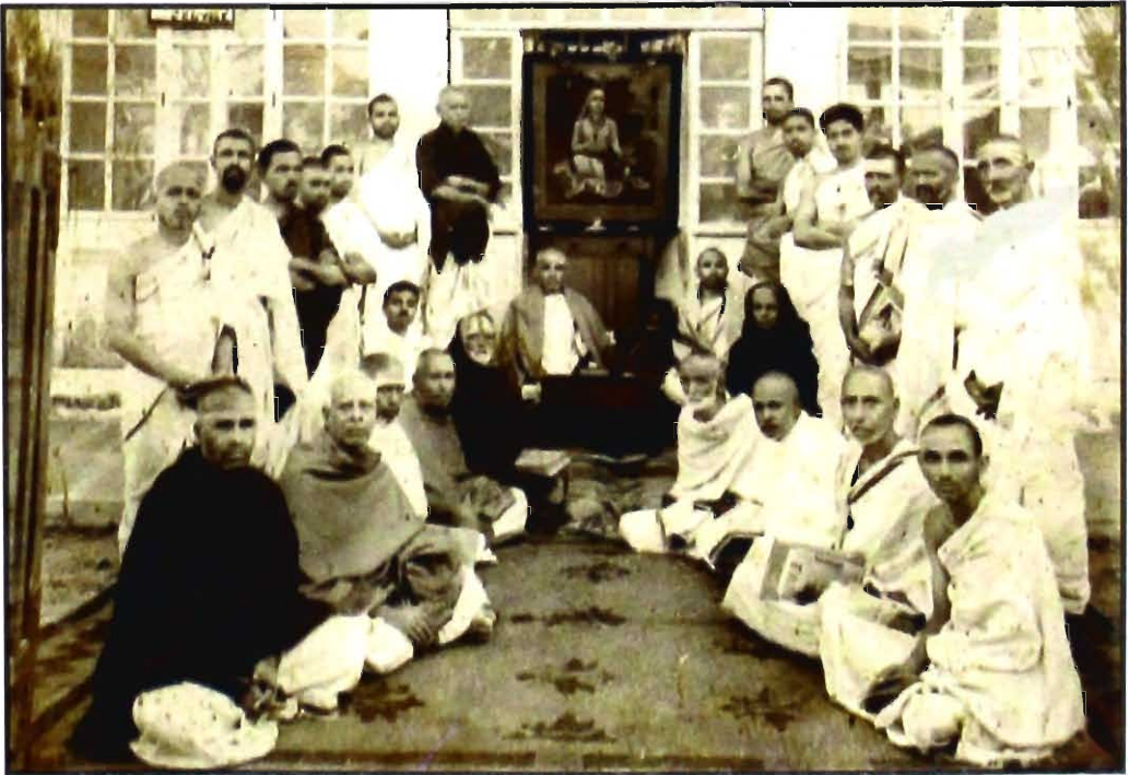
ಶಿವಮೊಗ್ಗದಲ್ಲಿ ಭಾಷ್ಯಶಾಂತಿ ಸಮಯದಲ್ಲಿ ಶಿಷ್ಯವೃಂದದೊಂದಿಗೆ