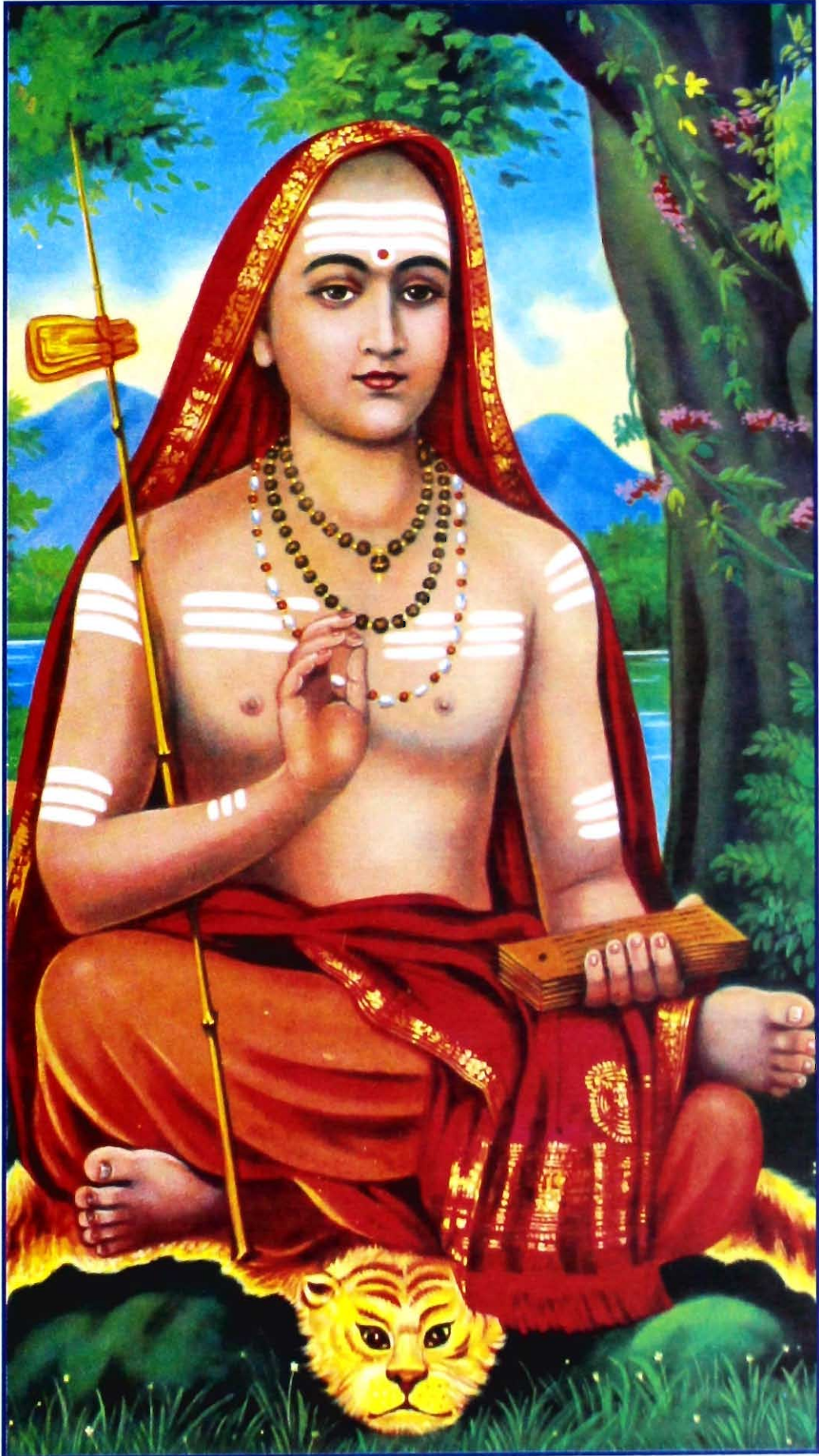
ಪೂಜ್ಯ ಭಗವತ್ಪಾದ ಶಂಕರಾಚಾರ್ಯರು