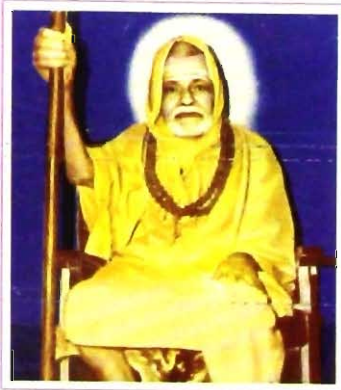
ಶ್ರೀ ಶ್ರೀ ಸಚ್ಚಿದಾನಂದೇಂದ್ರ ಸರಸ್ವತೀ ಸ್ವಾಮಿಗಳವರು